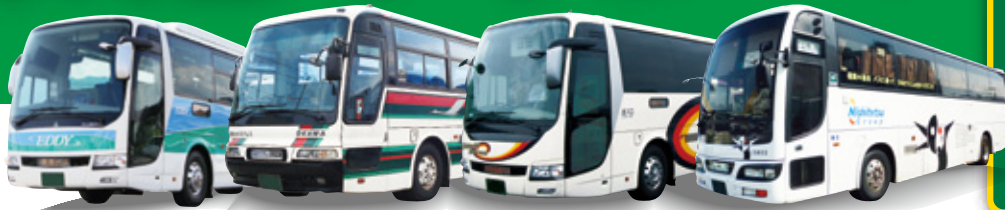
徳島バス株式会社